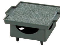
④石焼調理器 五万石 ㉞

ページコード 商品コード 価格 4-1747-0301 3290000 ¥11,800 石板寸法:180×150×H8 全高:100