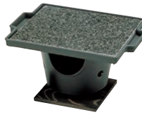
③石焼調理器 十万石 ㉞

ページコード 商品コード 価格 4-1747-0201 3289900 ¥19,800 石板寸法:220×220×H12