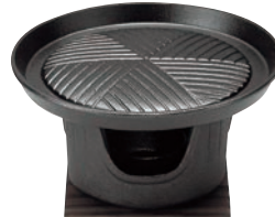
⑰アサヒ スタミナ コンロセット ㉞

ページコード 商品コード 価格 D502-40 4-1747-1601 6995500 鉄皿:φ150×H13 コンロ:φ125×H90