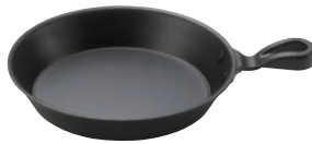
⑫丸型グリル鍋 17cm 片手 ㉞

ページコード 商品コード 価格 M11-507 4-1747-1101 7609000 φ170×H30 材質:アルミとステンレスの2層 ※専用グリル台は⑬⑭をお使いください。