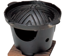
⑱アルミ ジンギスカン鍋セット ㉞

ページコード 商品コード 価格 D505-514 4-1747-1701 6995400 鉄皿:φ195×H13 コンロ:φ125×H90