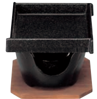
⑩SN 角型 卓上焼ミニ皿セット ㉞

ページコード 商品コード 価格 4-1747-0901 5240100 ¥2,500 φ130×H30 ※六角型(⑥)、片口(⑦)、丸型グリル(⑧)の鍋に使えます。