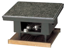
①石焼調理器 百万石 ㉞

ページコード 商品コード 価格 4-1747-0101 3289800 ¥44,000 石板寸法:220×220×H12 全高:140