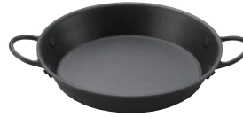
⑬丸型グリル鍋 17cm 両手 ㉞

ページコード 商品コード 価格 M11-508 4-1747-1201 7609100 φ170×H30 材質:アルミとステンレスの2層 ※専用グリル台は⑬⑭をお使いください。