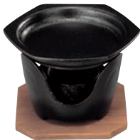
⑥SN 六角型 卓上焼ミニ皿セット ㉞

ページコード 商品コード 価格 4-1747-0601 5239700 ¥5,300 鉄皿:150×21 コンロ:φ120×H85 ※蓋は⑨をお使いください。