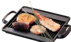
⑳焼物プレート さざ波 ㉞

ページコード 商品コード 価格 M10-577 4-1747-1901 8262900 φ180×H30 ●コンロセットにセット可能です。 ●フッ素3層コートでこげつきにくく洗い落としが楽です。 ●コンロセットはP1748-㉞小をご使用ください。