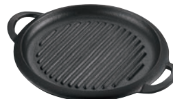
㉑IK ミニグリルプレート ㉞

ページコード 商品コード 価格 M10-549 4-1747-2001 8263000 220×150×H25 ●フッ素3層コーティングによりこげつきにくく洗い落としが楽です。