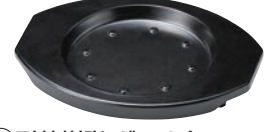
⑭耐熱樹脂 グリル台 ブラック ㉞

ページコード 商品コード 価格 M11-509 4-1747-1301 7609200 φ170×H30 材質:アルミとステンレスの2層 ※専用グリル台は⑬⑭をお使いください。